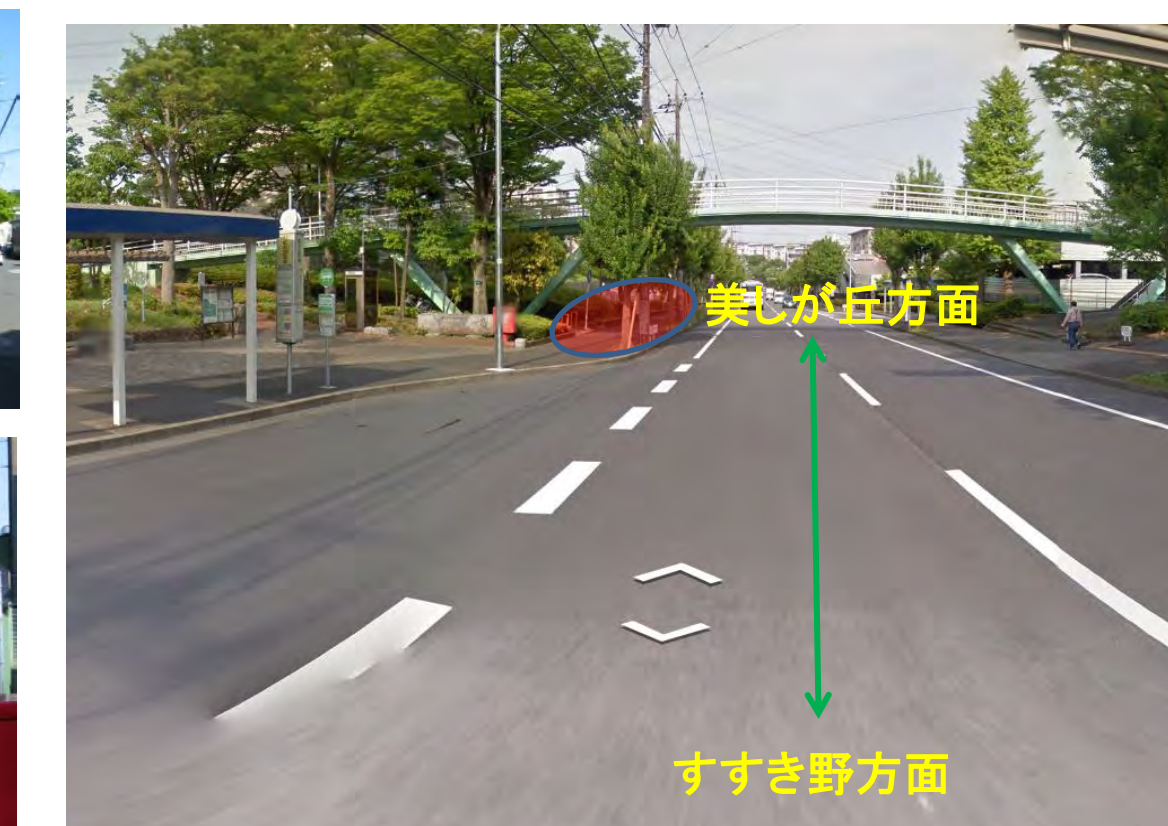
⑫虹が丘団地 歩道橋下