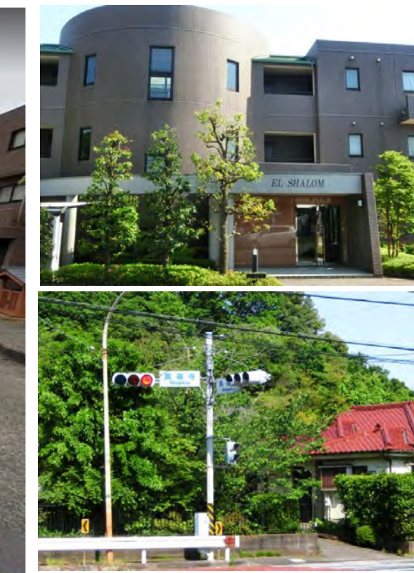
進行方向真福寺交差点