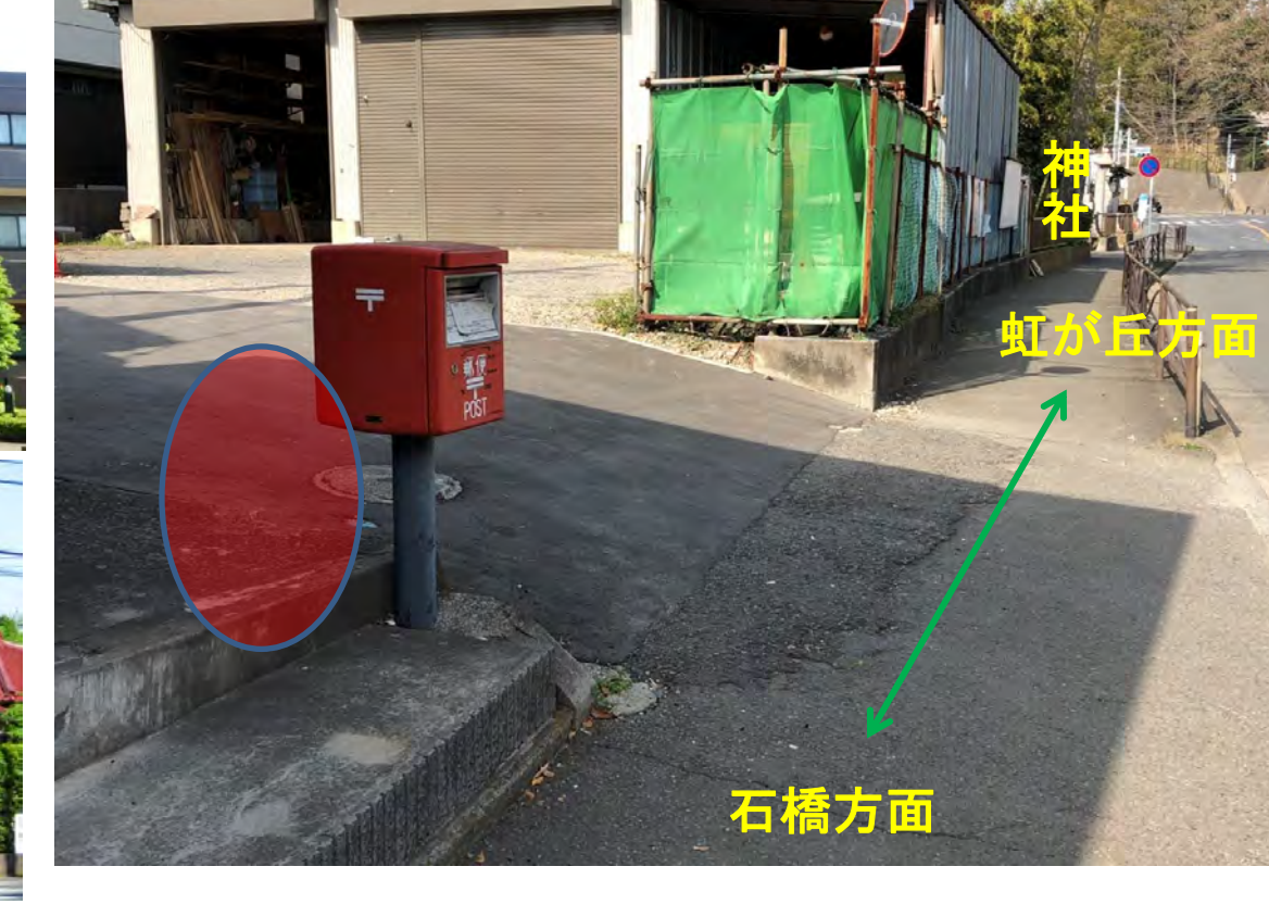
⑩琴平神社 進行方向の左側