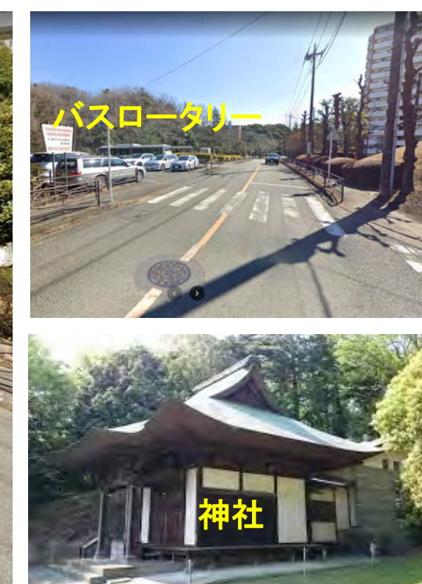
坂のふもとに白山神社