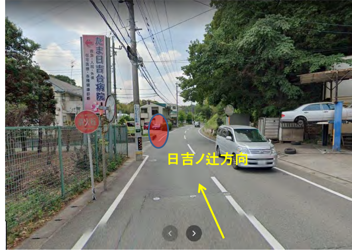
①たま日吉台病院 看板の先