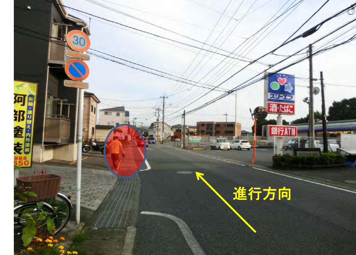
⑧スリーエフ向かい (下麻生2丁目)