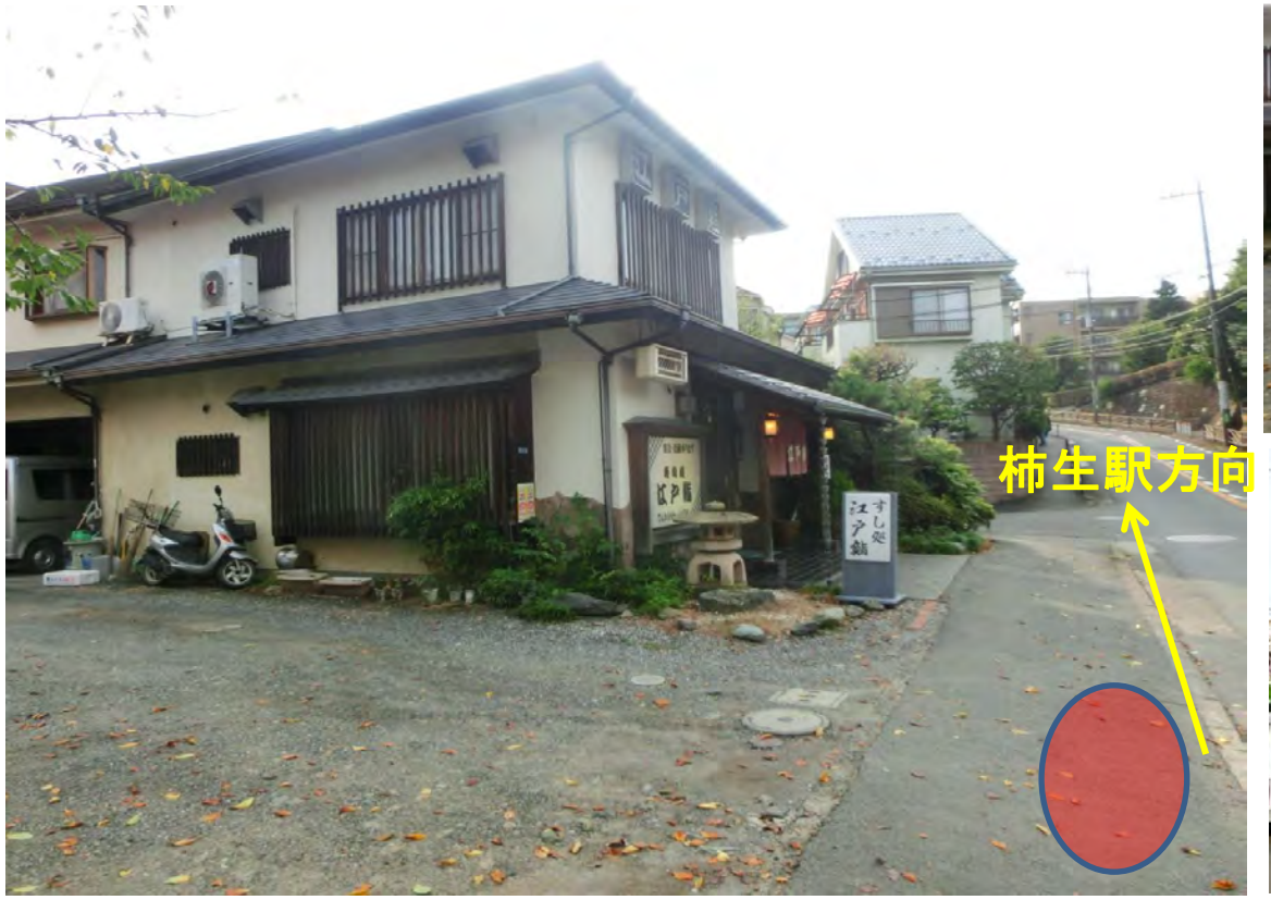
⑤江戸鮫(すし)前 真福寺小学校先