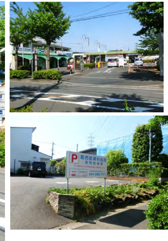
葛西皮膚科医院 駐車場そば