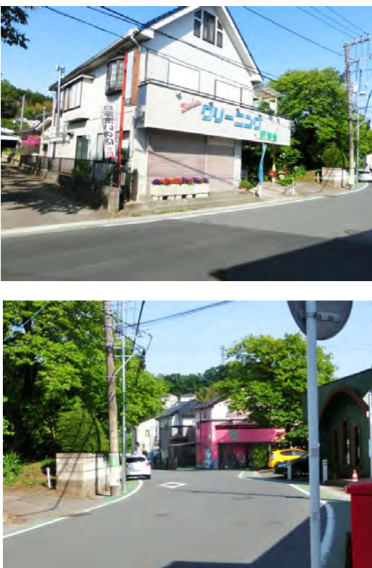
⑫虹が丘団地 歩道橋下