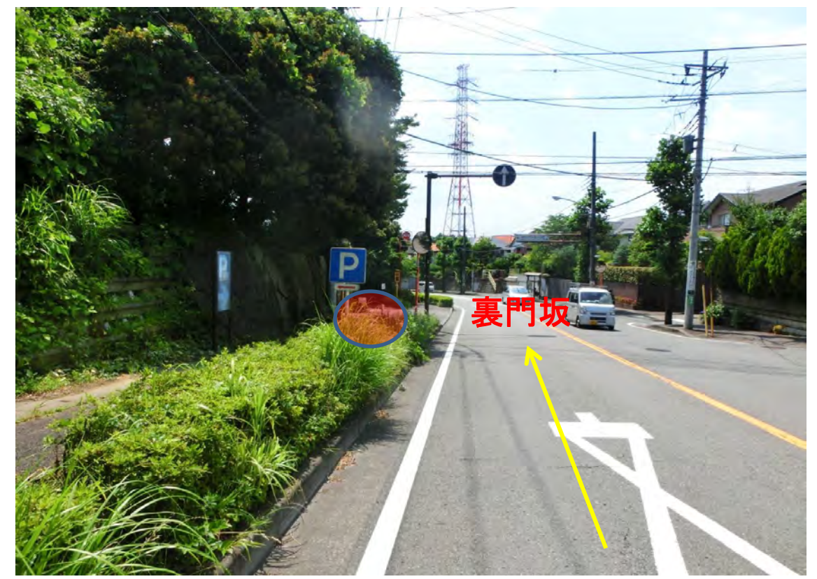
②裏門坂 バス停手前